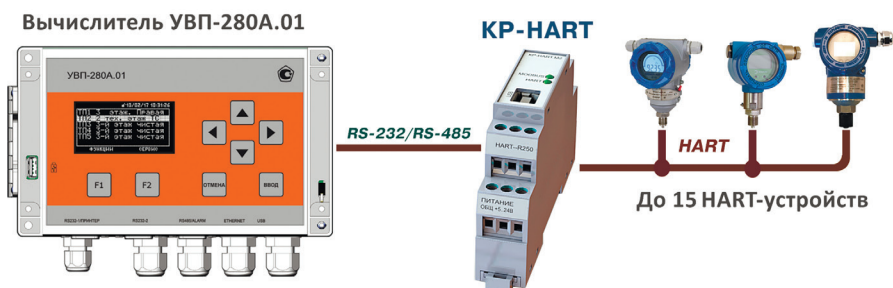
Рис. 2. Подключение контроллера KP-HART к вычислителю линейки УВП-280 в системе коммерческого учета

▶ максимальное количество повторных запросов для гарантированного получения данных в условиях плохого качества связи;